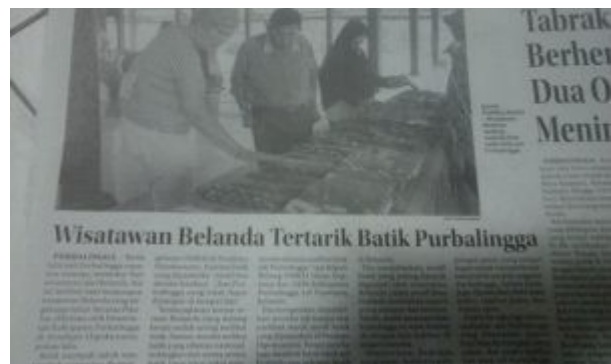
Krantenartikel bezoek Purbalingga 2018

We bezoeken vervolgens pepermuntfabriek Davos, zingen “ Lang zal ze leven” voor de jarige eigenares ( die tot onze verrassing bestuurslid is van de christelijke school die we bezochten) en zijn getuige van het proces waarin pepermuntjes van stof tot vorm komen en met verbluffende handigheid verpakt worden.