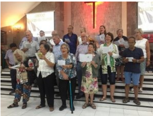
Gondomono kerk Semarang 2018

Na afloop van de dienst geeft de predikant met behulp van beamer een overzicht van wat Pikulan vanaf 2010 financieel voor de gemeente betekend heeft: een greep: school gebouwd, auto voor transport zieken en ouden van dagen, hulp bij herstel van huizen van arme leden na overstroming, 20 adoptiekinderen en 22 gezinnen, geld voor kerstvieringen. LCD-scherm. “Wat onmogelijk is maakt Pikulan mogelijk”.