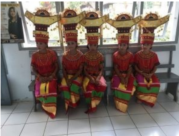
Ontvangst in Batulelleng 2018

Zorg over het voortbestaan van het lepradorp bestaat nu de gemeente plannen heeft de grond een andere bestemming te geven. Het aantal mensen in het dorp met lepra ligt beneden de 5%, is volgens de door de overheid gehanteerde norm te laag. De mensen maken zich ernstig zorgen over hun toekomst, ze hebben geen pensioen waarmee ze duurdere behuizing kunnen betalen. Na een wandeling door het dorp en praatjes, voor zo ver mogelijk, met de bewoners keren wij tegen 18.00 uur hotelwaarts. In het vertrouwen dat ook de avond zal beantwoorden aan onze verwachtingen, wel wetend dat de bestuursleden nog een vergadering voor de boeg hebben, zien wij terug op weer een geslaagde dag.