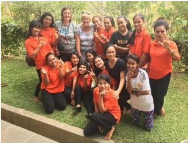
Diakonos dames 2018