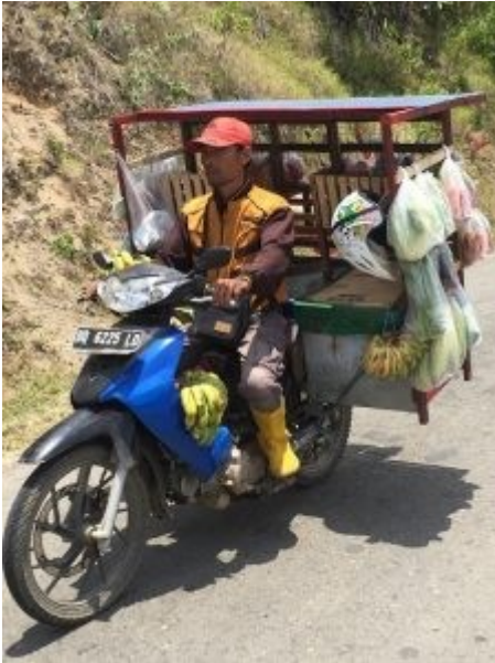
De groenteman in Torajaland 2018

Vandaag zullen we weer een lange reis maken. Om ruim 19.00 uur kan het ontvangstcomité van Toraja Misiliana Hotel de traditionele welkomstromroffel geven, gebruikelijk ritueel bij de aankomst van gasten. We zijn dan 11 uur onderweg geweest, weliswaar met enkele uitstapmomenten waarvan één om neer te strijken in een schitterend aan een baai gelegen restaurant en daar te lunchen en een ander moment 4 uur later in het gebied van de erotische bergen, niet nader te omschrijven. Voor trouwe volgers van de reisprogramma's van Erica Terpstra zou de bijzondere plek herkenbaar zijn. Zij was hier, haar foto is getuige.