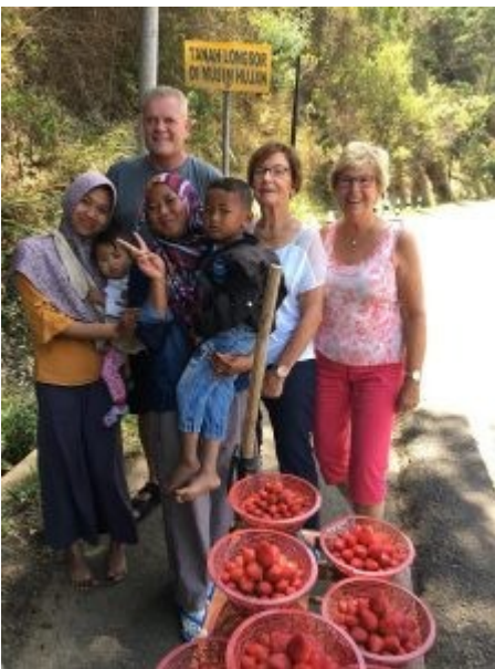
Straatverkoop van aardbeien

Er zal hopelijk een foto bij zijn van enkele mensen bij een aardbeienverkoopstalletje. De tekst op het gele bord betekent zoiets als : gevaar van aardverschuiving - bij hevige regenval en heeft dus niets met het gezamenlijke gewicht van de gefotografeerde reisgenoten te maken.