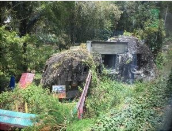
Graven in Toraja 2018

rotsgraven zien. Alvorens bijgezet te worden wordt de overledene na gebalsemd te zijn opgebaard in zo'n typisch huisje op palen, met de kenmerkende voor- en achtergevel en blijft daar tot de familie voldoende geld heeft gespaard voor de ceremonie, die recht doet aan de status van de gestorvene (en familie). N.B. een karbouw kost tussen de 1000 en 1500 euro.