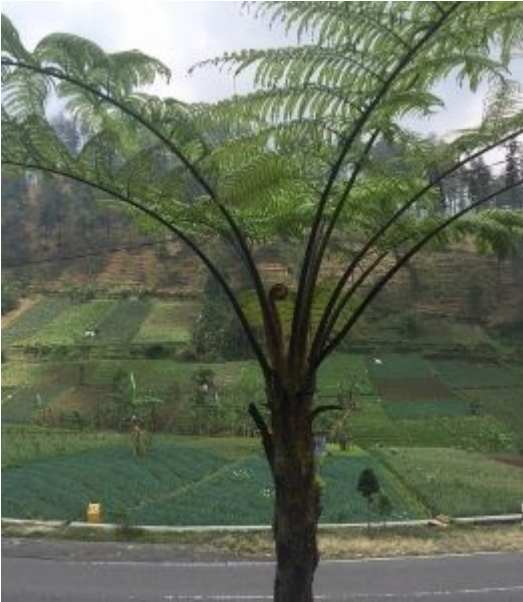
Landschap onderweg 2018