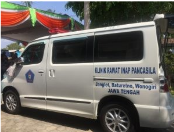
Nieuwe ambulance Baturetno 2018

Na nog weer veel foto's en handen schudden vertrekken wij naar Baturetno een uur verderop. De rit voert weer door een prachtig landschap met rijstvelden in alle stadia van groei en groen. Project Baturetno houdt in : een kraamkliniek, inmiddels uitgegroeid tot bescheiden bredere hulppost en adoptiekinderen. De kinderen van de kliniek houden zich stil de adoptiekinderen laten des te luider van zich horen, ook hier tromgeroffel.