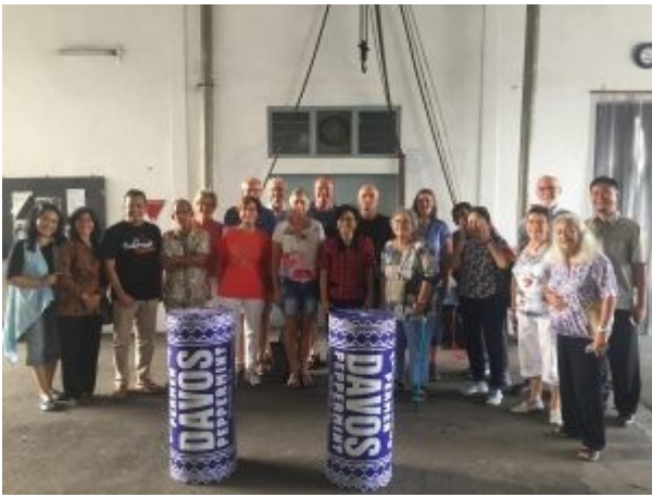
Bezoek Davos fabriek 2018

Met een spectaculaire dokar tour (denk aan Friese sjezen met paarden maar dan alles minstens de helft kleiner )wordt het bezoek aan Purbalingga besloten. Ons wacht vanavond nog een diner in restaurant Table Nine met ongetwijfeld veel gezelligheid en een hartroerend afscheid.