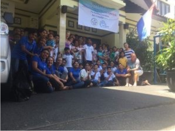
Bezoek Kolewa 2018

websiteadres. Via Pikulan eventueel meer info.