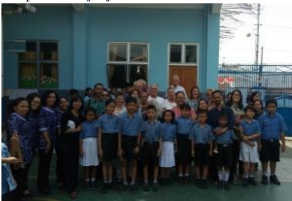
Adoptiekinderen SD Kristen Purwokerto 2018

Purwokerto is de stad waar wij sinds gisteravond verblijven. Martha heeft voor vandaag en de komende 2 dagen een overzichtelijk programma samengesteld. We bezoeken eerst de SD Kristen 2, een christelijke basisschool. Ik heb begrepen dat er 2 christelijke scholen in Purwokerto. zijn. De geschiedenis van dit project is bijzonder. Een Groningse professor die hier als medicus werkte adopteerde bij zijn vertrek 10 kinderen van deze school en liet bij testament vastleggen dat na zijn