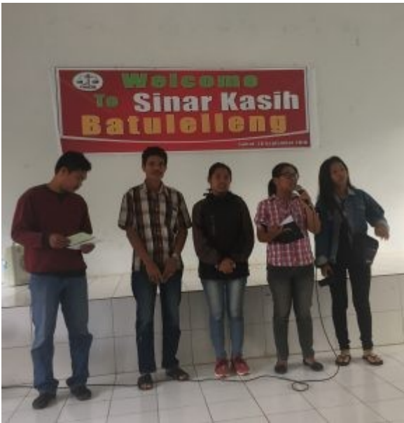
Ontvangst in Batulelleng 2018