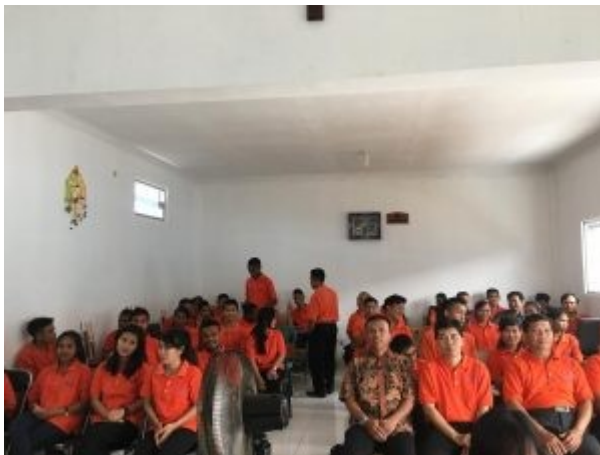
Diakonos studenten in klas 2018

Terwijl de bestuursleden en directie vergaderen bezoekt het andere deel van ons gezelschap een koekjesbakkerij in Purwokerto. De oprichter is christen, evenals zijn vrouw en heeft relaties met Diakonos. Het is hem aan te zien dat hij dit werk al 21 jaar doet. Uren per dag werken boven en in een gloeiendhete vuurkorf waarin zijn product op een speciale manier gebakken wordt maakten dat zijn gezicht eruit ziet alsof hij vele operaties in een brandwondencentrum heeft ondergaan. Arbeidsomstandighedenwet? We zijn niet in Nederland.