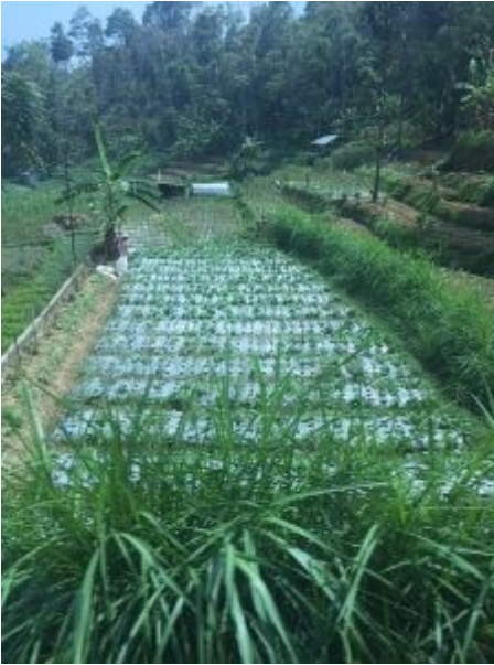
Landschap onderweg 2018

Er zal hopelijk een foto bij zijn van enkele mensen bij een aardbeienverkoopstalletje. De tekst op het gele bord betekent zoiets als : gevaar van aardverschuiving - bij hevige regenval en heeft dus niets met het gezamenlijke gewicht van de gefotografeerde reisgenoten te maken.