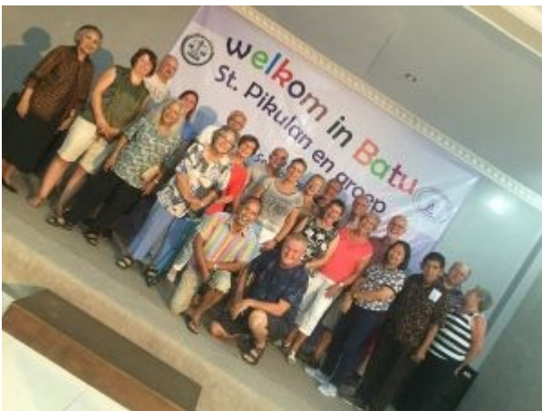
Groepsfoto in Batu 2018

Het bestuur slaat zich moedig door een langdurige fotosessie heen. Gevoed en gelaafd maar bovenal gesterkt door het besef van verbondenheid met deze gemeenschap van kinderen, ouders en werkers keren wij naar ons luxe hotel terug. Wij moeten ons opmaken voor de reis naar Soerabaja waarbij een gecompliceerde bagageverdelingsprocedure in acht genomen moet worden want wat niet mee moet in het vliegtuig naar Sulawesi moet wel mee met een auto naar Bali en omgekeerd.