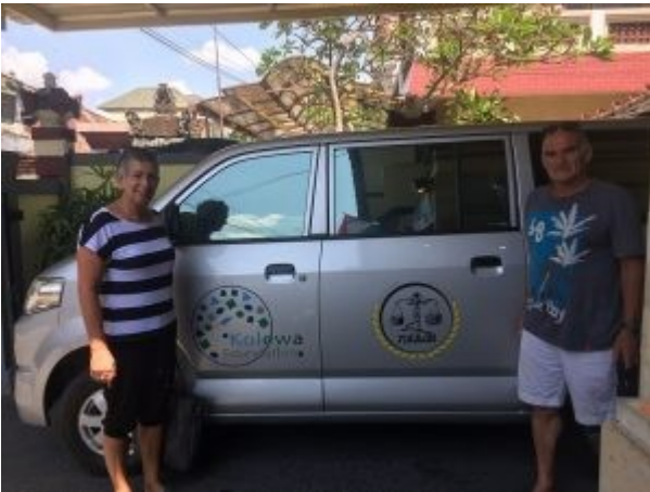
Kolewa transport 2018

De mensen die deelnamen aan dit bezoek, besluiten unaniem de taxichauffeurs te instrueren hen naar Tanah Lot te brengen, een hindoetempeltje fraai gelegen op een hoge rots in de zee. Inderdaad, zoals verwacht, mooi. De vrees dat ook vele anderen het wilden zien wordt bewaarheid, ook dat de weg niet zeer lang maar wel langdurig zou zijn. In het hotel ontmoeten wij aan het buffet ook een aantal van ons dat vandaag een rondrit heeft gemaakt in de regio. De groep is weer compleet, herenigd kunnen wij de nacht in gaan.