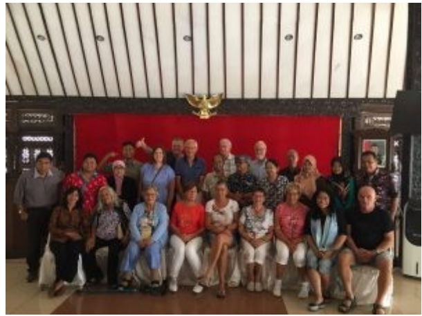
Bezoek regent 2018