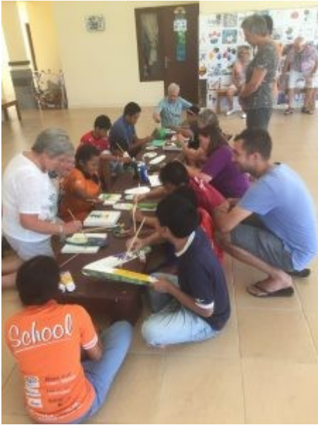
Activiteit Sjaki Tari Us 2018

Dagelijks worden er ongeveer 60 kinderen begeleid, onderverdeeld in 3 groepen. We doen mee met een schilderuurkje, de kinderen lijken het de gewoonste zaak van de wereld te vinden. Ook hier voelen we diep respect voor wat jongeren voor hun naaste doen. Denken aan je toekomst, hoe bedoel je?