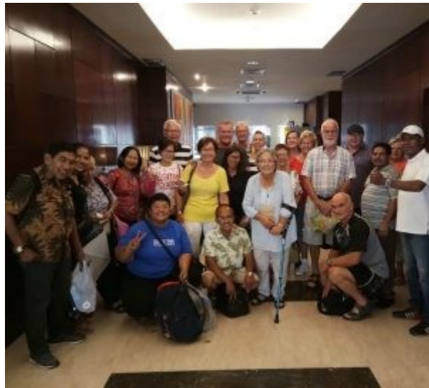
Groepsfoto Pikulanreis 2018