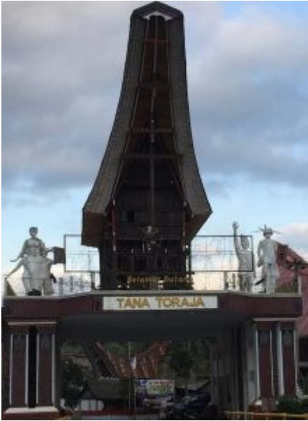
Toegangspoort naar Tana Toraja 2018

Uiteindelijk bereiken we de toegangspoort tot Torajaland, uiteraard een fotomoment en van zulk een gewicht dat wij niet in de bus maar te voet het land der Torajas binnentreden. Direct gekenmerkt door de aparte bouwstijl van aan voorouders gewijde huisjes op palen en de karbouwen in of langs de natte rijstvelden. Torajaland is het enige deel van Sulawesi dat niet islamitisch maar christelijk is. We zien veel kerken, geen moskeeën.