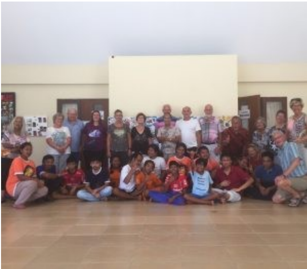
Pikulangroep bij Sjaki Tari Us 2018

Dagelijks worden er ongeveer 60 kinderen begeleid, onderverdeeld in 3 groepen. We doen mee met een schilderuurkje, de kinderen lijken het de gewoonste zaak van de wereld te vinden. Ook hier voelen we diep respect voor wat jongeren voor hun naaste doen. Denken aan je toekomst, hoe bedoel je?