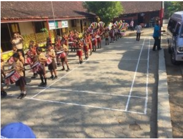
Schoolkinderen Baturetno 2018

Na nog weer veel foto's en handen schudden vertrekken wij naar Baturetno een uur verderop. De rit voert weer door een prachtig landschap met rijstvelden in alle stadia van groei en groen. Project Baturetno houdt in : een kraamkliniek, inmiddels uitgegroeid tot bescheiden bredere hulppost en adoptiekinderen. De kinderen van de kliniek houden zich stil de adoptiekinderen laten des te luider van zich horen, ook hier tromgeroffel.