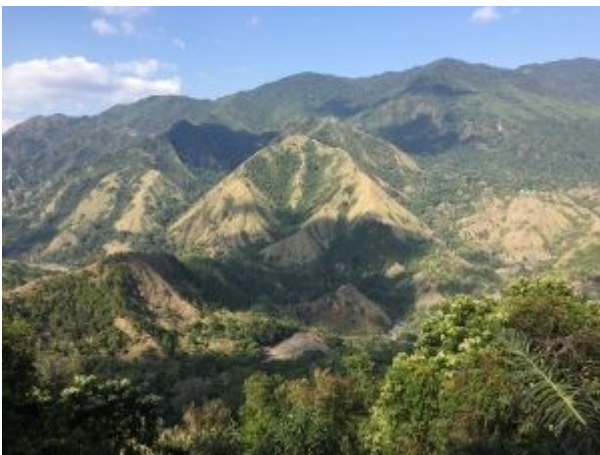
Erotische bergen 2018

Vandaag zullen we weer een lange reis maken. Om ruim 19.00 uur kan het ontvangstcomité van Toraja Misiliana Hotel de traditionele welkomstromroffel geven, gebruikelijk ritueel bij de aankomst van gasten. We zijn dan 11 uur onderweg geweest, weliswaar met enkele uitstapmomenten waarvan één om neer te strijken in een schitterend aan een baai gelegen restaurant en daar te lunchen en een ander moment 4 uur later in het gebied van de erotische bergen, niet nader te omschrijven. Voor trouwe volgers van de reisprogramma's van Erica Terpstra zou de bijzondere plek herkenbaar zijn. Zij was hier, haar foto is getuige.