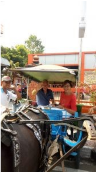
Dokar tour 2018

Met een spectaculaire dokar tour (denk aan Friese sjezen met paarden maar dan alles minstens de helft kleiner )wordt het bezoek aan Purbalingga besloten. Ons wacht vanavond nog een diner in restaurant Table Nine met ongetwijfeld veel gezelligheid en een hartroerend afscheid.