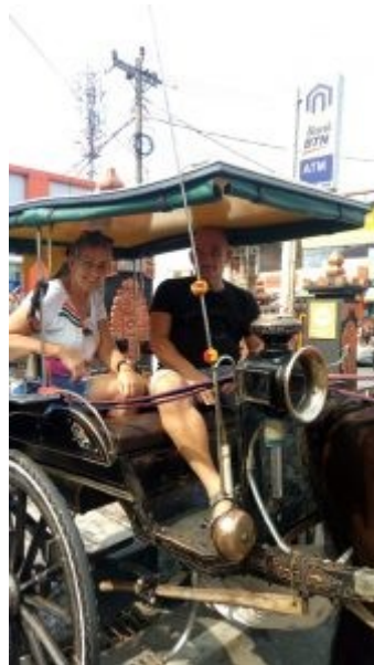
Dokar tour 2018