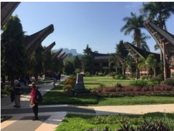
Traditionele Toraja woningen 2018

Hotel Misiliana bestaat evenals het hotel in Batu uit afzonderlijke of geschakelde huisjes verspreid over een prachtig parkachtig terrein. Een lust voor het oog en rustgevend voor vermoeide lichamen. Welverkwikt komen de meesten van ons uit de nacht en vinden het ontbijt op dezelfde plaats die zij gisteren in het duister verlieten, een open ruimte omgeven door bloemen en gazons.