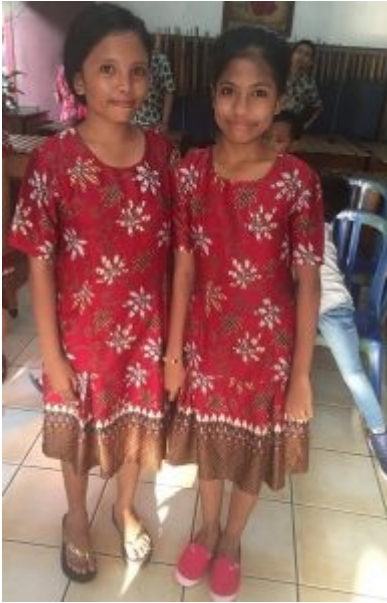
Usaha Mulia 2018 - een plaatje !

Terwijl bestuursleden zich beijveren in een bespreking de projectpartners zo goed mogelijk te begrijpen en zichzelf verstaanbaar te maken, maken de anderen zich op voor de terugtocht naar het hotel om om 19.00 uur al of niet in aangepaste kleding een Balinese avond met buffet te beleven. De rijvaardigheid van de chauffeurs roept weer aller bewondering op gepaard gaande met verwondering over geduld en zelfbeheersing en samenwerking in het verkeer van de misschien wel duizenden verkeersdeelnemers in de straten van Denpasar en Kuta. Het buffet was heerlijk, de danseressen mooi, de nacht lauw en diepdonkerblauw, de 25e dag.