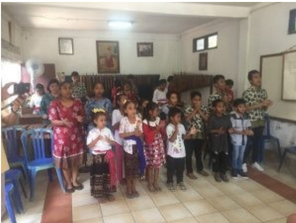
Usaha Mulia ontvangst 2018