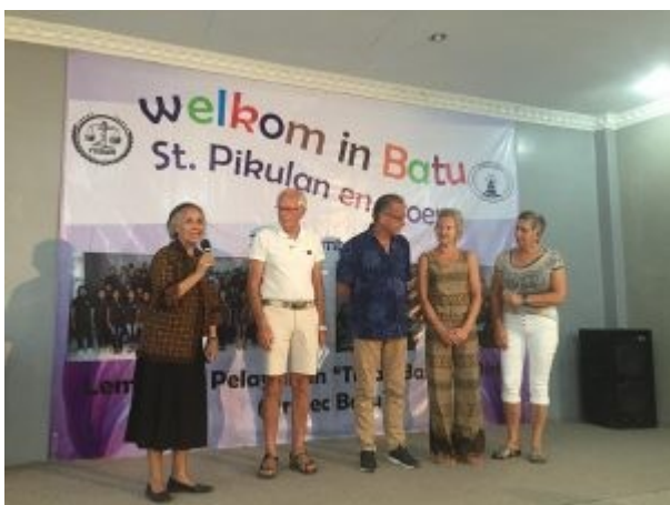
Ontvangst in Batu 2018

Zoals eerder vermeld is Batu het grootste project van Pikulan op Java. Dat is te zien en te horen want de zaal van ontvangst, gebouwd met hulp van Wilde Ganzen en Pikulan zit vol met, ik schat wel ruim 100 kinderen en ouders. Het zou ongeloofwaardig zijn na eerdere hoogtepunten ook hier van een hoogtepunt te spreken, laat ik maar gewoon zeggen: het was super in alle opzichten. Een blijde bijeenkomst, dankbaarheid en waardering over en weer. Een korte meditatie vanuit het bijbelverhaal over Esther, weeskind, in huis genomen en religieus en sociaal opgevoed door Mordechai eindigt met de woorden (vertaald): onze steun (st. Pikulan en project Batu) zal kinderen voortbrengen met een sterk geloof en goede mentaliteit om ook de medemens te mogen en kunnen helpen. Einde citaat. Geholpen worden om dan ook zelf te helpen. Het gebeurt: naast de 140 kinderen die door Pikulan gesteund worden, helpt project Batu zelf 40 kinderen.(kleine correctie op