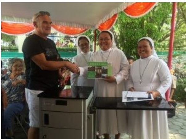
Overhandigen cheque PKN Oudwoude – Westergeest Bezoek Baturetno 2018

grote gift, waarvoor deze gemeente en de Hemel gedankt wordt. Nog een verrassing heeft er de afgelopen tijd plaatsgevonden doordat er 11 klaptafels/ kastjes aangeschaft konden worden dankzij de jaaractie van de PKN Westergeest die 3000 euro opbracht. Geweldig!