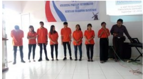
Studenten Diakonos 2018