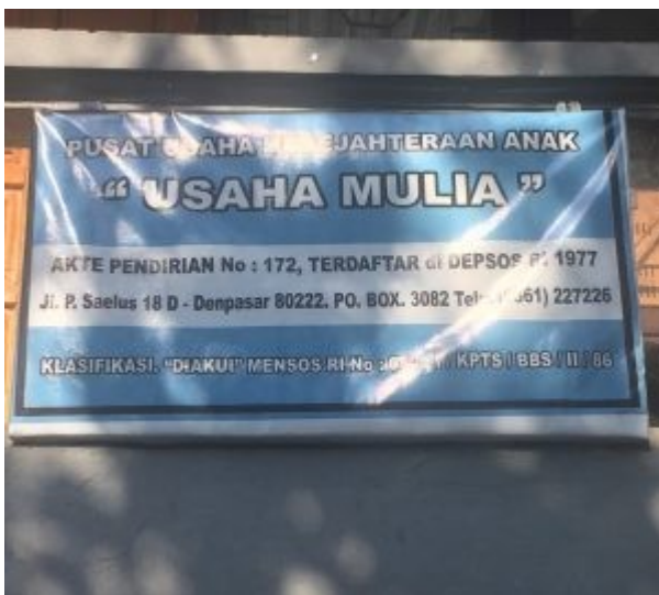
Usaha Mulia uithangbord

Omdat we pas tegen 16.00 uur bij het project Usaha Mulia verwacht worden is er alle gelegenheid de omgeving te verkennen. Sommigen verdiepen hun ervaring met het zwembad en aanliggende percelen in het eenvoudige ritme van droog-nat-droog, eindeloos herhaalbaar. Anderen kiezen voor het hete zand van het strand en houden hun vochtbalans met behulp van door vrijwillige en dus vlijtige strandwerkers gretig aangeboden drankjes in stand tegen een geringe vergoeding en welgemeend terima kasih.